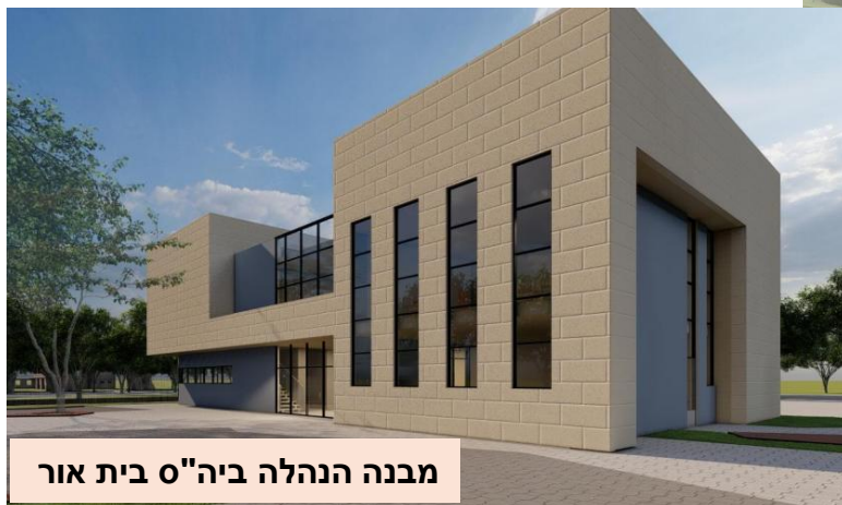
מבנה הנהלה ביה"ס בית אור